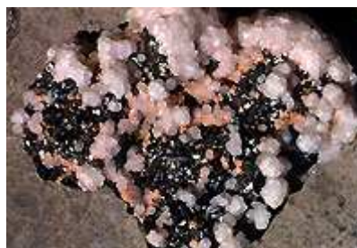
Blende, Rhodochrosite, Arsenopyrite et Calcite