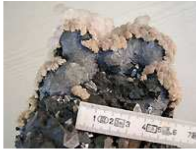
Blende marmatite (xx de un à deux cm), galène coulante, rhodochrosite