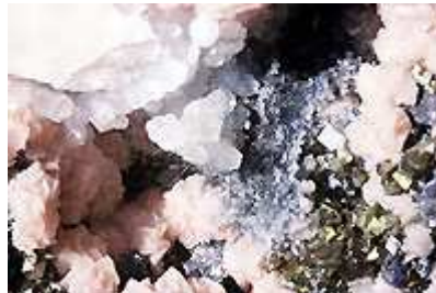
Plumosite, rhodochrosite, calcite, arsenopyrite