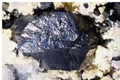
Marmatite 7 cm (mâcle du spinelle)