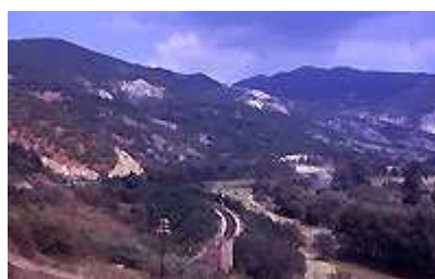
Bassin tertiaire de la vallée de l'Ibar