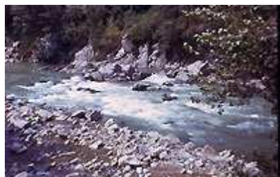
Affleurement de serpentines

La mine de Trepca a fourni aux musées et aux collectionneurs du monde entier des spécimens exceptionnels de divers minéraux, notamment vivianite, ludlamite, jamesonite, pyrrhotite, arsénopyrite, dolomite, et plus communément de très belles blendes marmatites. C'est un géant qui pèse 60 millions de tonnes de minerai contenant 5 millions de tonnes de plomb et zinc métal. Le triste sort qui frappe ce gisement célèbre, depuis 1990 et la guerre du Kosovo, justifie largement de lui accorder une page Internet.