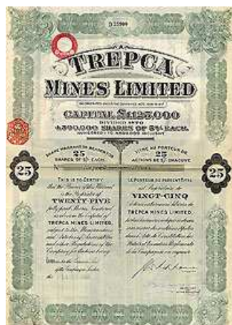
Action de la mine de Trepca

Le Combinat Minier, Métallurgique et Chimique de Plomb et Zinc de Trepca va alors devenir l'un des plus importants complexes miniers des Balkans et il regroupe différentes mines : au Nord (dans les Monts Kopaonik) Crnac et Belo Brdo (dont le minerai est traité à la laverie de Leposavic), Koporic et Zuta Prlina qui sont en exploration ; au centre, Stari Trg et la laverie de Tuneli i Pare ; au Sud et Sud-Est (vers Pristina) Artana-Novo Brdo, Hajvalija, Kisnica-Badovac avec la laverie de Gracanica. L'ensemble a produit le chiffre astronomique de 60,5 millions de tonnes de minerai tout-venant à plus de 8 % Pb+Zn, dont la moitié rien qu'à Trepca. C'est un des plus grands districts Pb-Zn d'Europe, avec un tonnage métal produit de près de 3 Mt de plomb et 2 Mt de zinc. On estime sa production d'argent à plus de 4500 t. Ses réserves géologiques sont aujourd'hui considérables, même si les chiffres avancés naguère sous économie dirigée doivent être aujourd'hui repassés au crible des critères de rentabilité et de l'économie de marché.