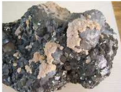
Blende marmatite, galene coulante, rhodochrosite