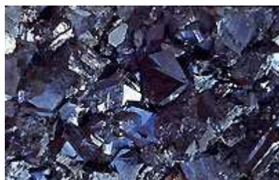
Blende marmatite cristaux de 3 cm d'arête

Des espoirs de reprise de la mine sont maintenant permis. La mission des Nations Unies au Kosovo (MINUK, en anglais UNMIK) qui gère provisoirement cette province, a lancé avec l'approbation de toutes les parties un important programme d'évaluation technique et économique d'une reprise de l'exploitation des divers sites industriels du combinat. Ce programme a été confié en août 2000 au consortium ITT (Interim Team for Trepca) qui comprend les américains Morrison & Knudsen-Washington Group, Boliden Contech, et TEC Ingénierie, société française du groupe Eramet.