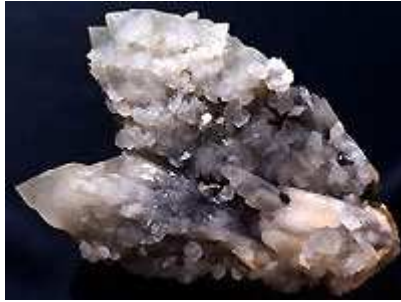
Quartz et calcite 15cm