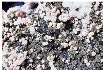
Galène, sphalérite (1 cm), arsenopyrite, rhodochrosite, calcite et pyrite