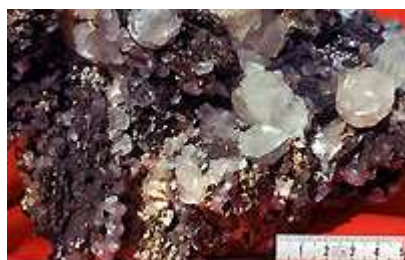
Pseudomorphose pyrrhotite- marcasite, calcite