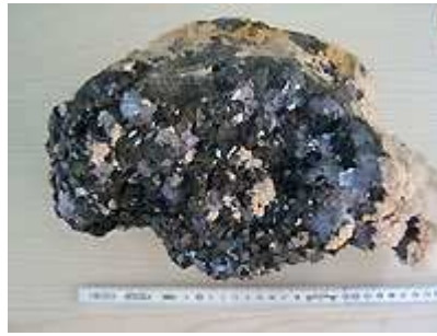
Blende marmatite (xx de un à deux cm), galene coulante, rhodochrosite