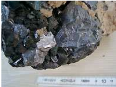
Blende marmatite (xx de un à deux cm), galène coulante, rhodochrosite