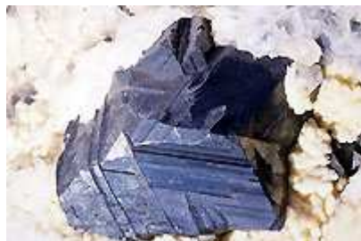
Sphalérite: 5 cm diam, calcite, dolomie

A l'oreille des collectionneurs, on "instillera" aussi qu'à ce jour aucune des stalactites de carbonates minéralisées en sulfures trouvées à Trepca n'a présenté de canalicule axial pour l'écoulement des gouttes qui perlent usuellement au plafond des cavités, ce qui indique que le karst était totalement noyé et que les géodes n'ont pas été tapissées à l'air libre par les sulfures, mais sous tranche d'eau (plus ou moins chargée en sels minéraux). Donc, informez nous svp si vous trouvez un compte gouttes dans votre échantillon ! Car ce serait un scoop.