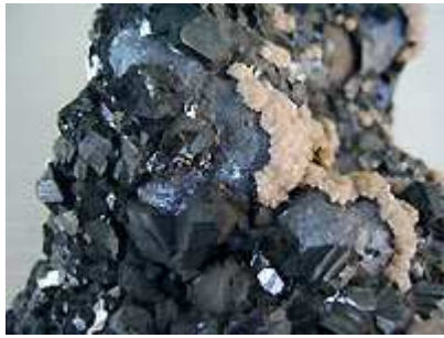
Quartz et calcite 15cm