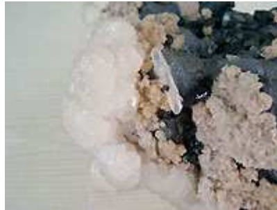
Blende marmatite, galène coulante, rhodochrosite