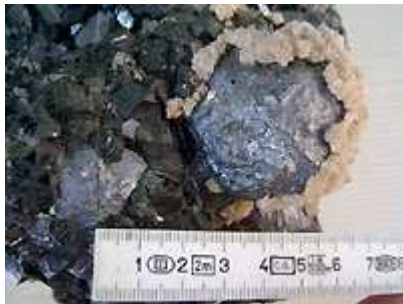
Blende marmatite (xx de un à deux cm), galene coulante, rhodochrosite"