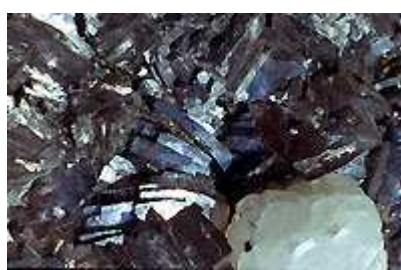
Arsenopyrite, calcite 3 cm